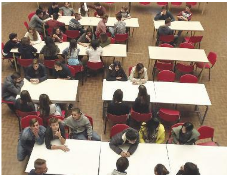
Ragazzi a lezione e a destra un'immagine dell'istituto Fermi

C'è la possibilità di prendere la maturità italiana e quella francese